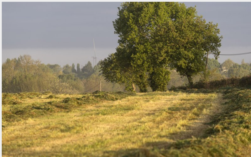
(Stephan Menoret-Ville de Nantes)