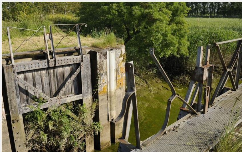
(Stephan Menoret - Ville de Nantes)