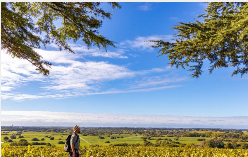
(Solutions & Co - ©Clo&Clem)