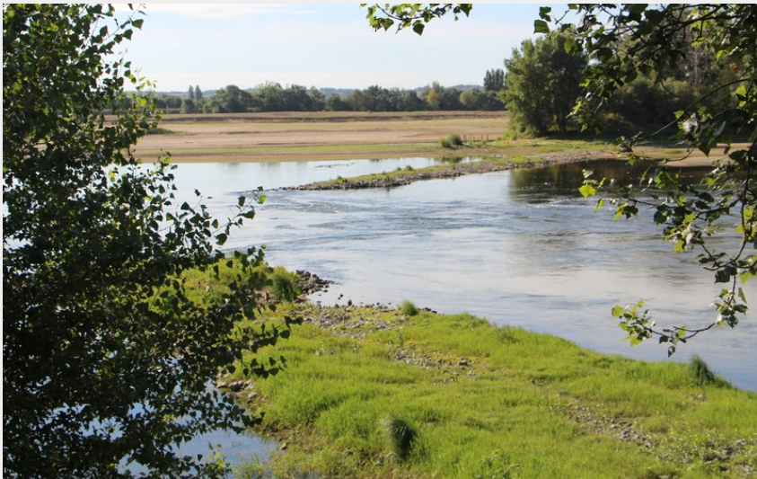
Circuit des Mariniers (COMPA)