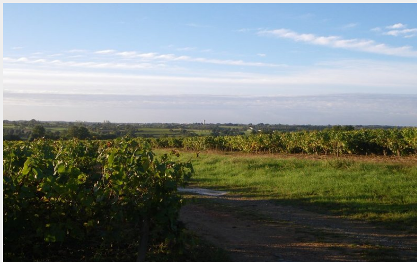
(office de tourisme vignoble nantes)