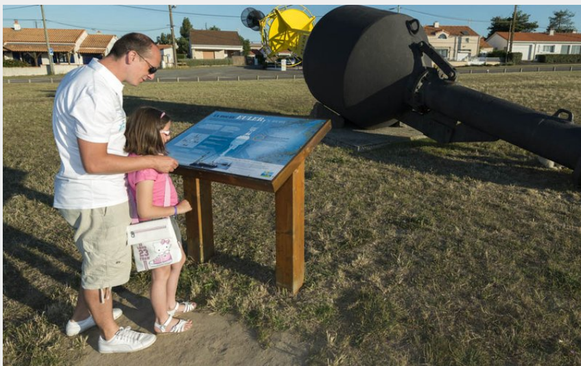
Bouée Euler_5 (Valéry Joncheray)