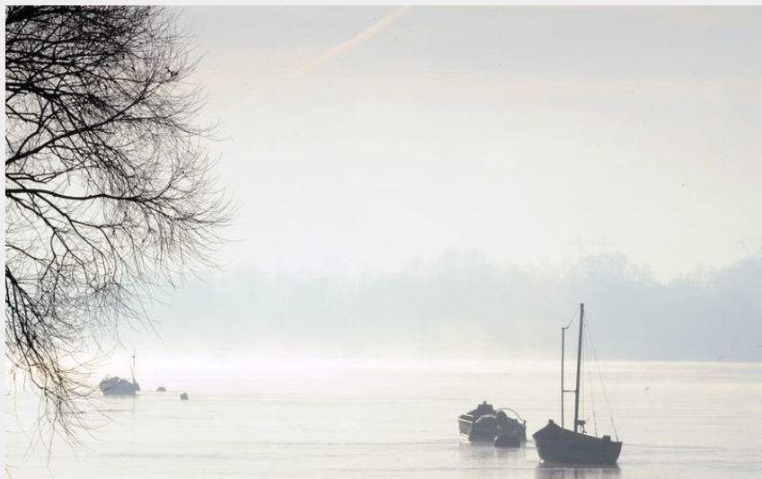
(Rodolphe Delaroque-Ville de Nantes)