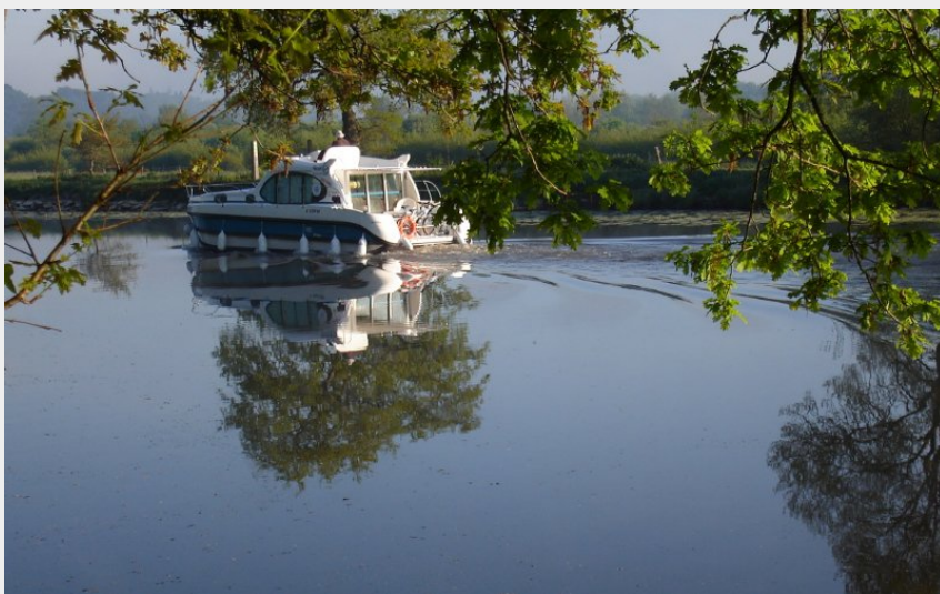
(Office de Tourisme entre Brière et Canal)