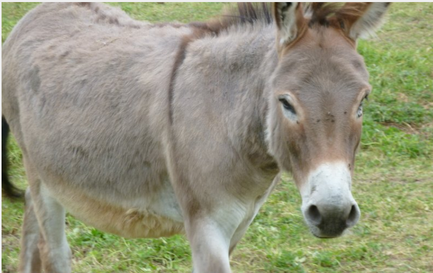
(Office de Tourisme entre Brière et Canal)