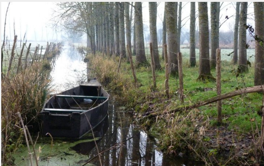
(Mairie de Drefféac)