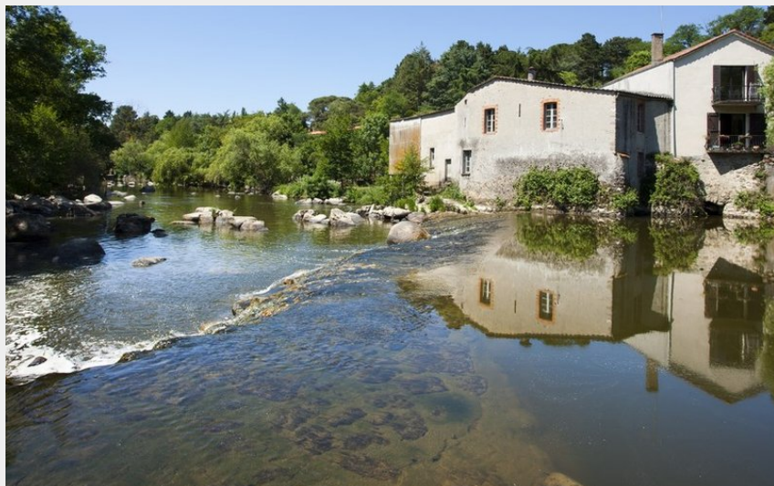
(BOUCLE CIRCUIT DES ROCHERS BOUSSAY)