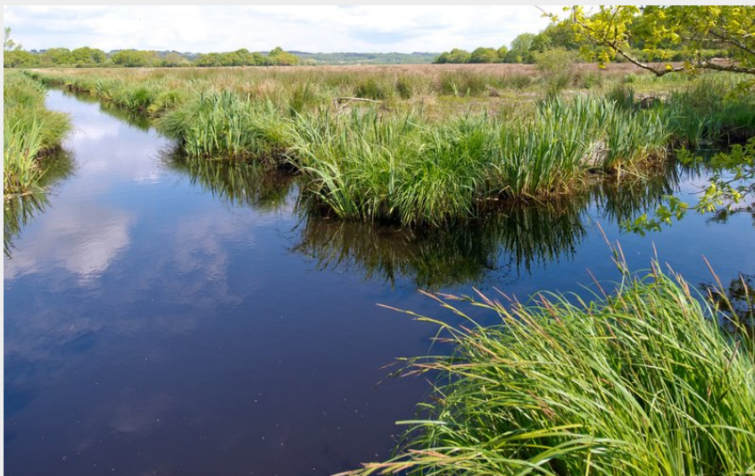
(© Patrice DORIZON)