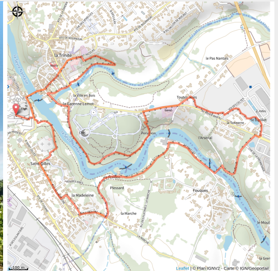
boucle coeur de clisson (1)

Le patrimoine clissonnais sous vos yeux, la fraîcheur des bords de Sèvre à vos pieds