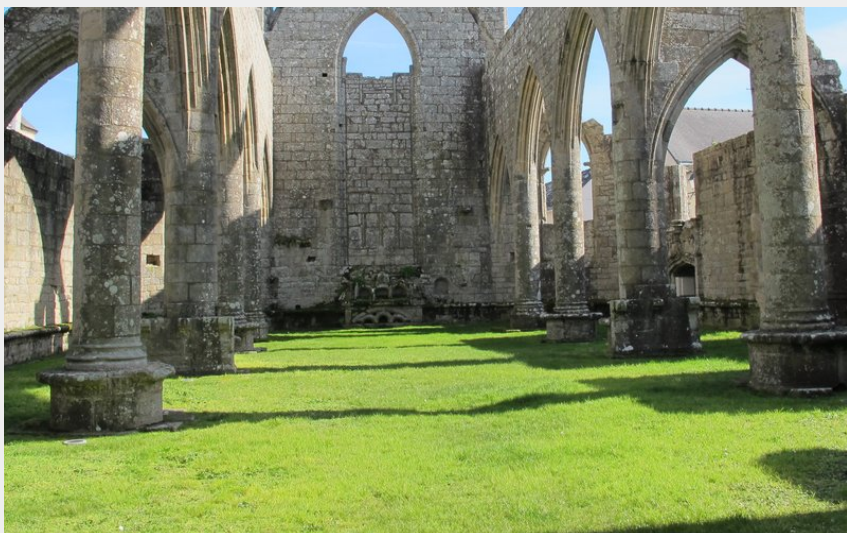
Chapelle du Mûrier_13 (Mairie de Batz-sur-Mer)