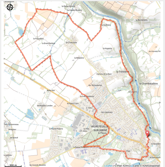
Circuit entre bourg et Maine