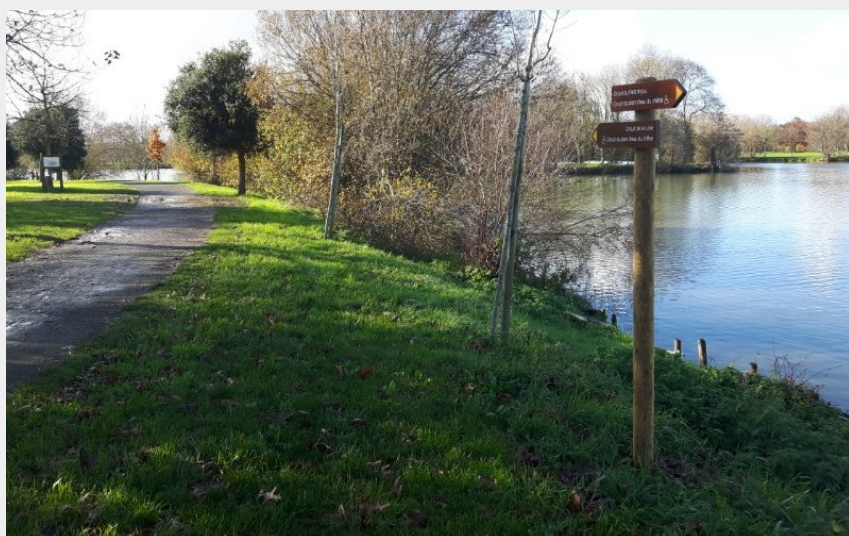
2020-circuit-plan-eau-chene-st-julien-de-concelles--1--2 (office de tourisme vignoble de nantes)