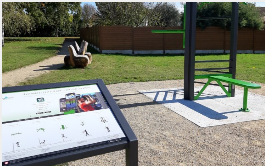
Aire fitness - Le circuit de la Coulée verte à Sainte Pazanne_3 (Julie Girard)