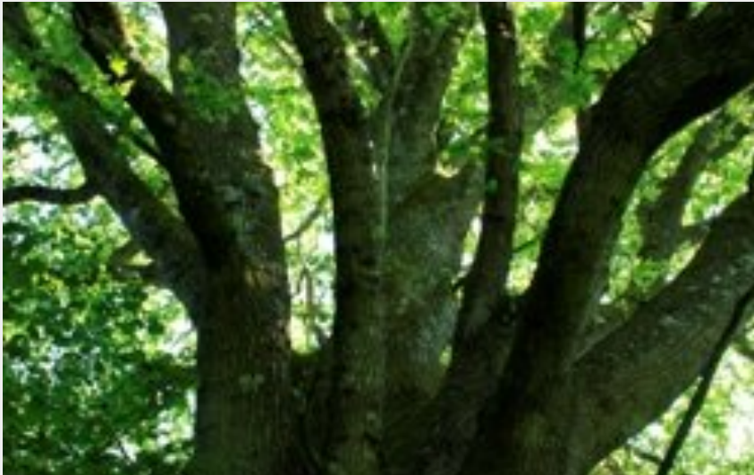
Vigneux -chêne_remarquable