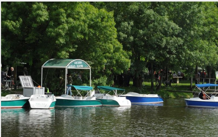
(Rodolphe Delaroque - Ville de Nantes)