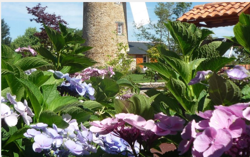
Le Grand Moulin des Places (7)