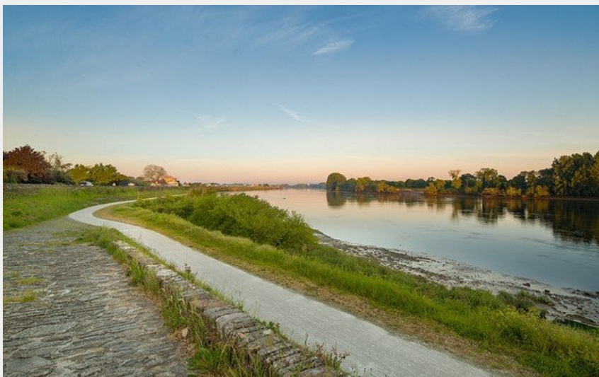
circuit-loire-stdeconcelles-©Brunner-levignoblenantes-tourisme (7) (©BRUNNER-OTVN)