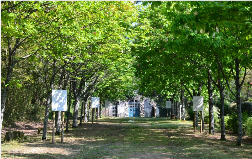
(Office de Tourisme entre Brière et Canal)