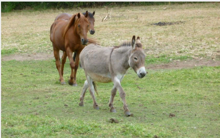
(Office de Tourisme entre Brière et Canal)