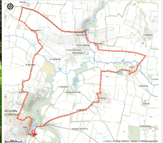
Sentier des côteaux de la Chère - St Aubin-des-Châteaux - CP CCCD (Communauté de Communes Châteaubriant-Derval)

De jolis chemins creux vous entraîneront le long de la Chère et vous pourrez observer un paysage rural vallonné, des villages typiques et découvrirez le passé industriel avec les Forges de la Hunaudière.