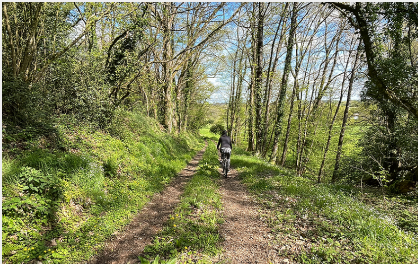
(Communauté de communes Châteaubriant Derval)