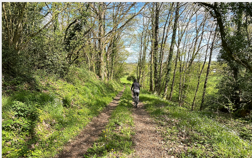
Sentier de la Pierre Rouge- Rougé (Communauté de communes Châteaubriant Derval)