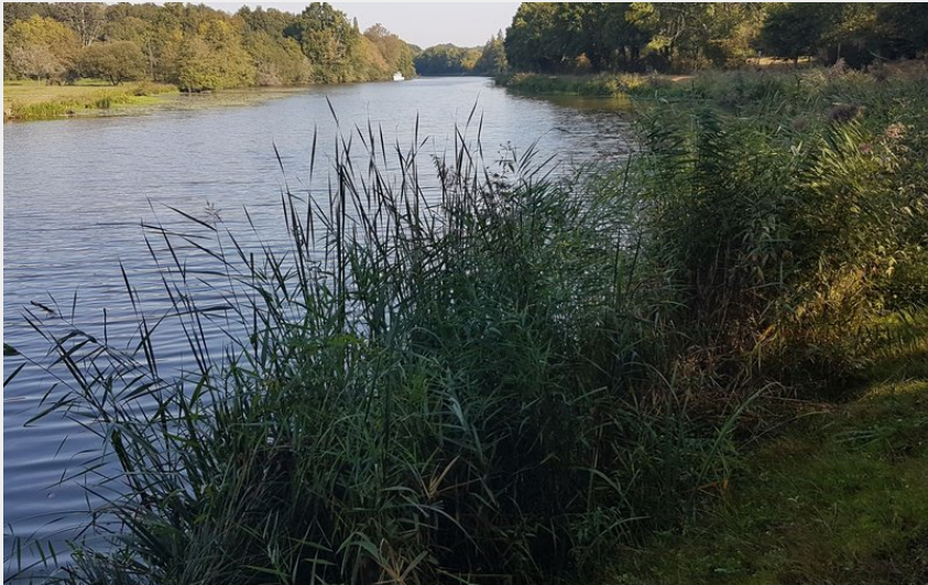
L'Isac - Canal de Nantes à Brest_3