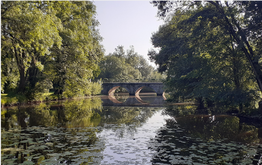
(Communauté de Communes Châteaubriant Derval)