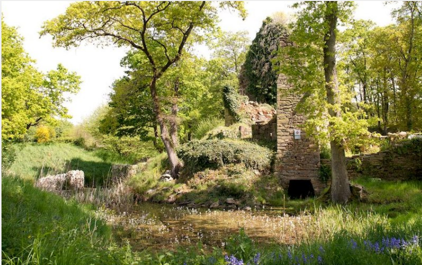
(© Patrice DORIZON)