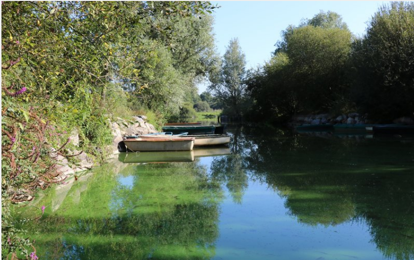
Les Landes de Tréjet (OTGL)