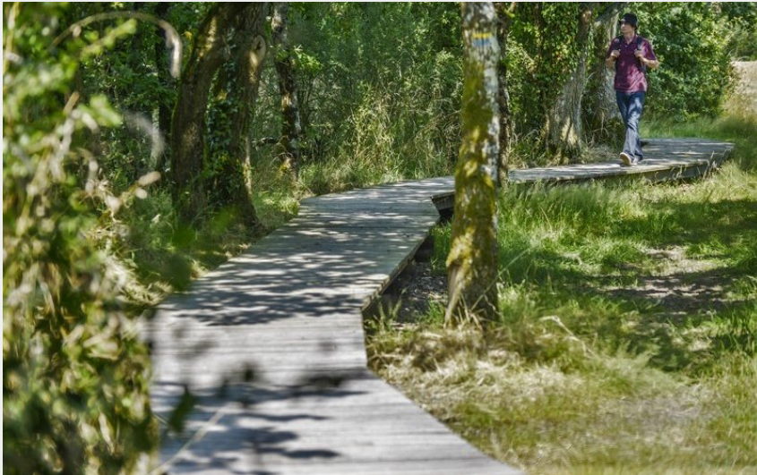
La Petite Marchande_3 (J. Martin)