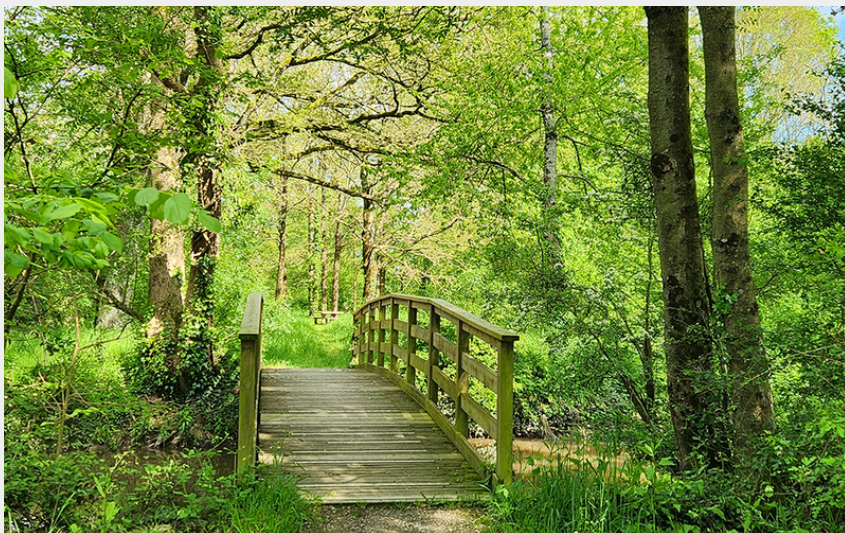
(Communauté de communes Châteaubriant-Derval)