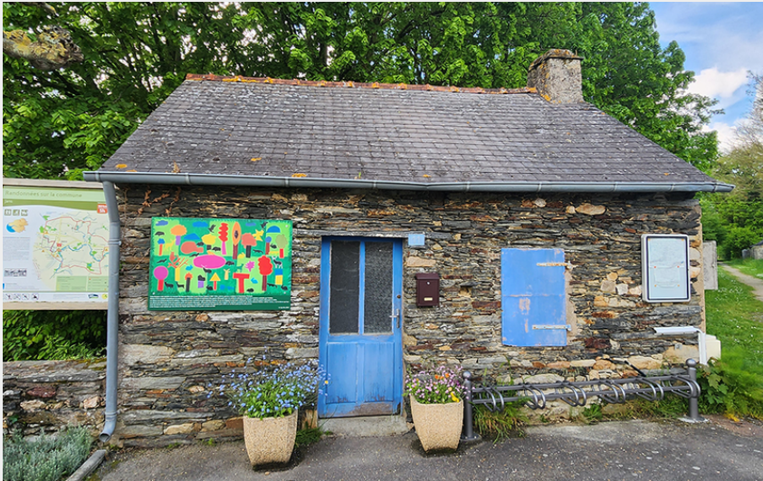
Sentier de l'étang de la Pierre (Communauté de Communes Châteaubriant-Derval)