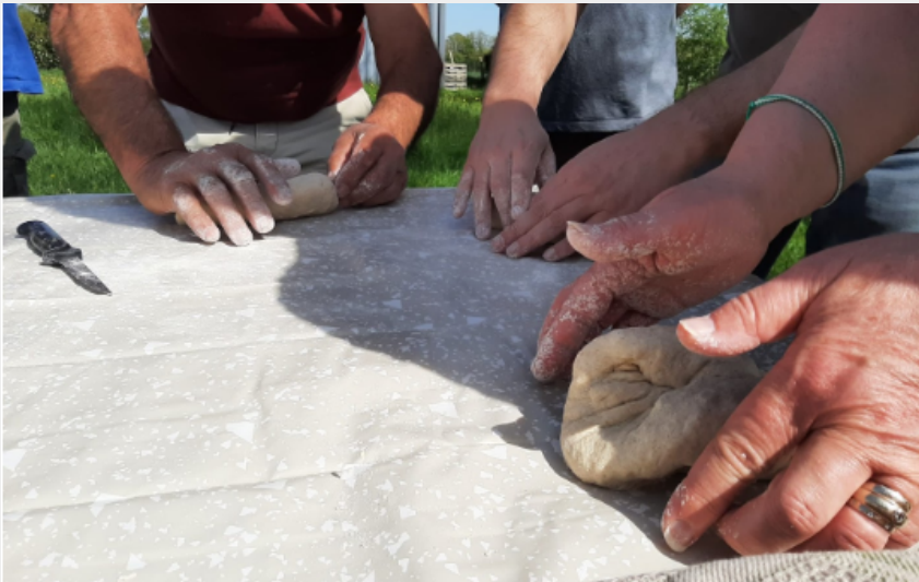
Crédit : Fabrication de pain moulin de la Bicane (Moulin de la Bicane)