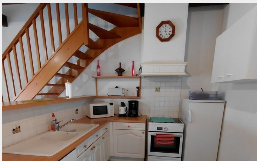
Crédit photo : 413319 - Cuisine La Maison Léon (Clévacances France)