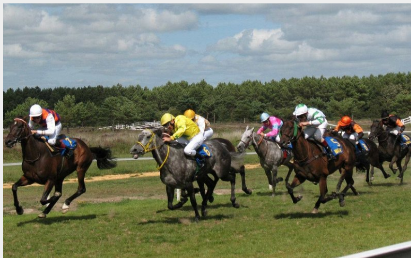
Crédit photo : courses-hippiques-le-gavre-44-fma-1 (© OT-Pays-Blain)