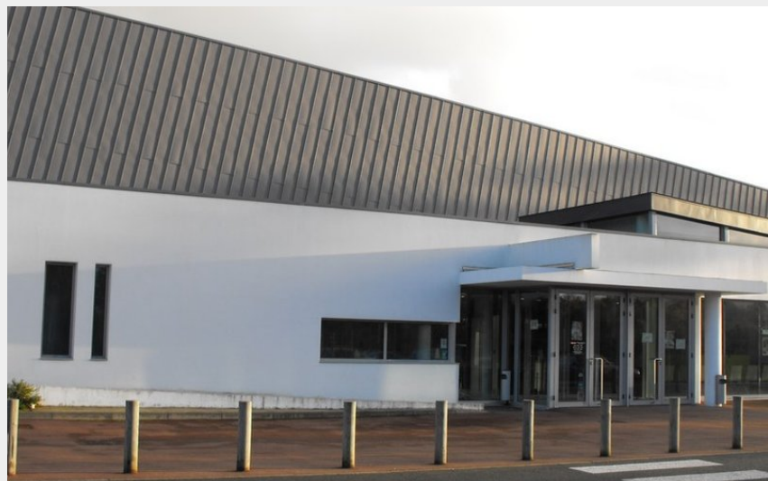
Crédit photo : 2016-loisirs-Le Quatrain-Haute Goulaine-44-LOI (salle de spectacle le Quatrain)