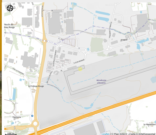
Crédit : aéroclub-pays-ancenis-ancenis-44-LOI-2 (© aéroclub-pays-ancenis)

L'aéroclub vous propose de survoler le Pays d'Ancenis et découvrir les paysages et sites du territoire en avion de tourisme, ou ULM multiaxes.