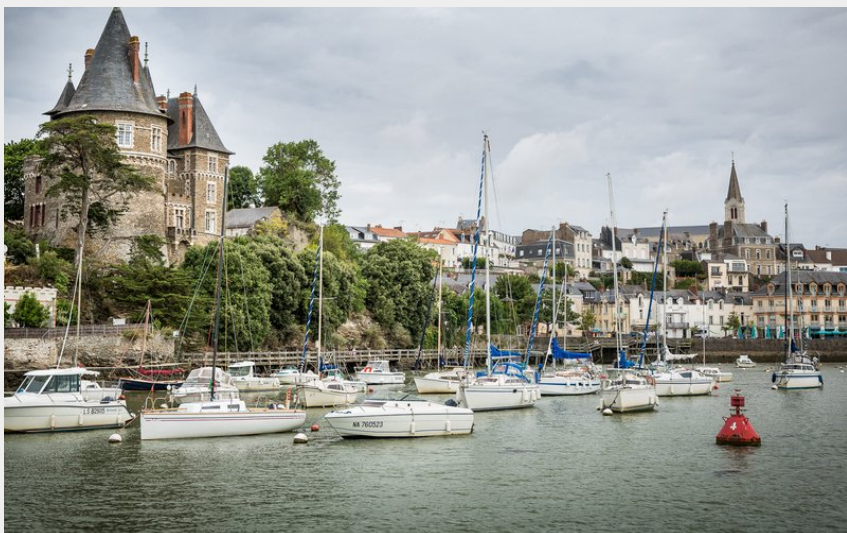
Pornic, port de pêche