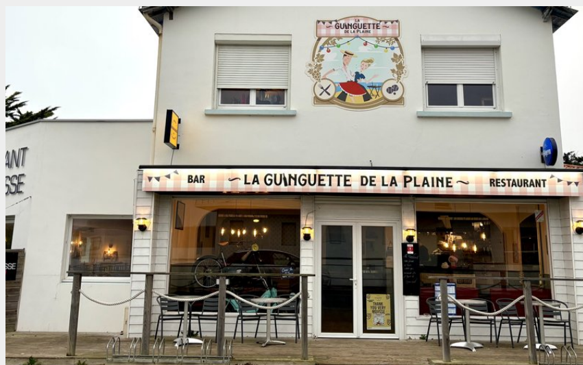
Crédit photo : La Guinguette de la Plaine_1 (Claudia Cassano Dromain)