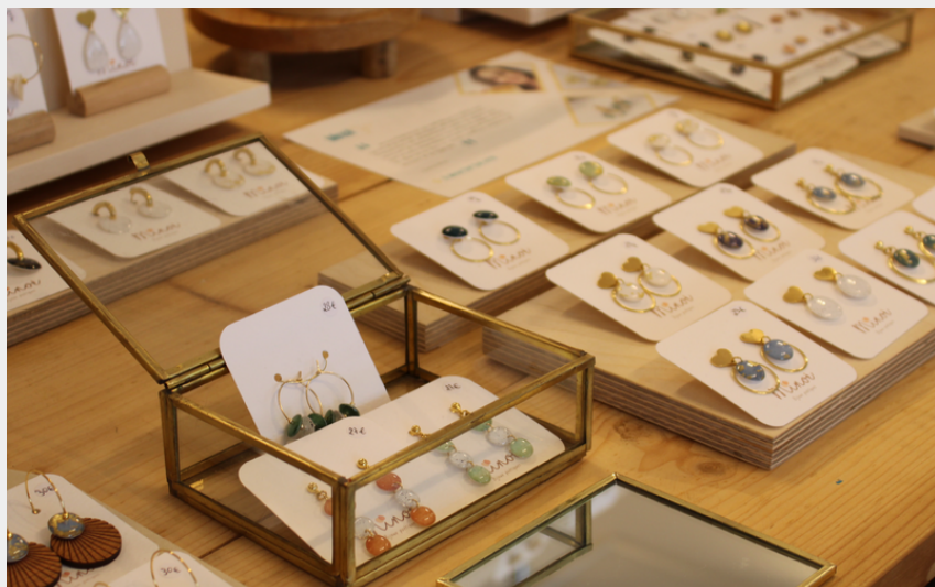
Crédit photo : L'Envolée, artisanat local : cadeaux faits main_2 (L'Envolée, artisanat local)