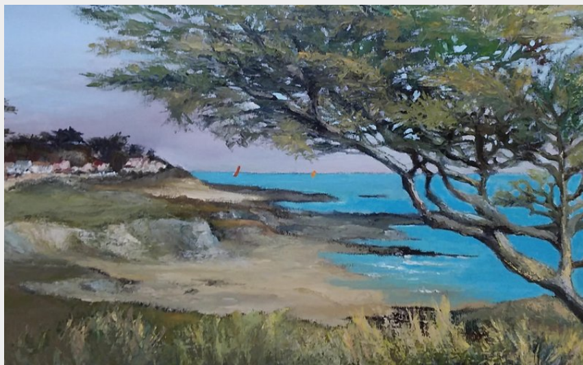
Crédit photo : Le chêne vert - huile sur toile_5 (Catherine-Rose Charlemagne)