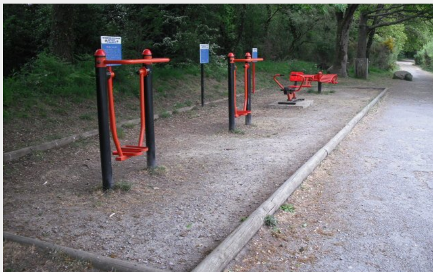
Crédit photo : Ateliers de renforcement musculaire 1 de Guindreff (@mairiestnazaire)