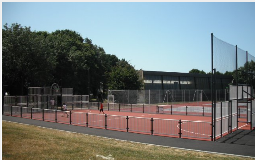
Crédit photo : Parcours et ateliers sportifs, Stade de Reton (@mairiestnazaire)