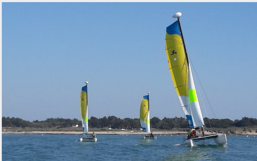
Crédit photo : catamarans Hobie T1_4 (École de Voile de Préfailles)