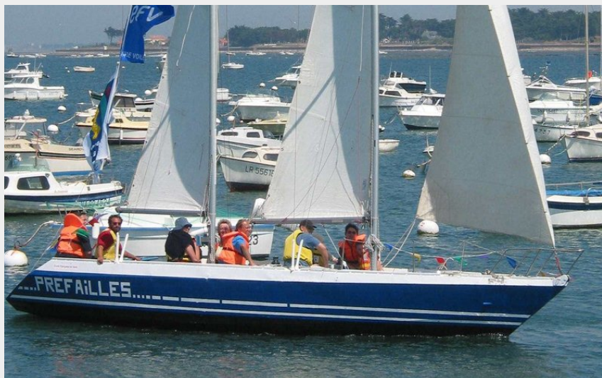
Crédit photo : Sortie en mer en goélette_1 (École de Voile de Préfailles)