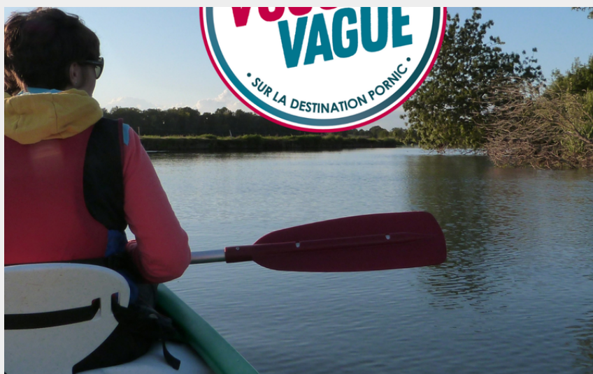
Promenade insolite en canoë - Escapade Nature_1