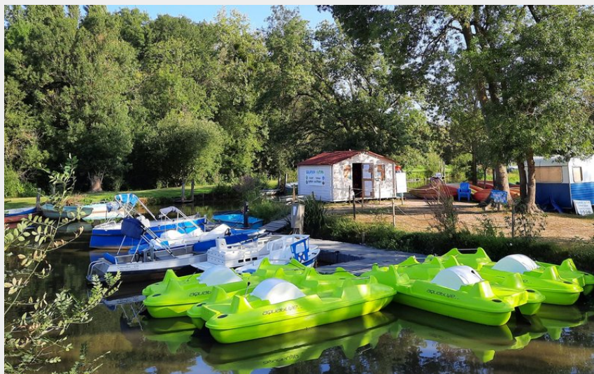
Location de pédalo - Escapade Nature à Port-Saint-Père_1