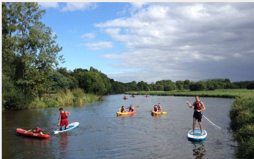
Crédit photo : Location de paddle - Escapade Nature à Port-Saint-Père_1 (DR)