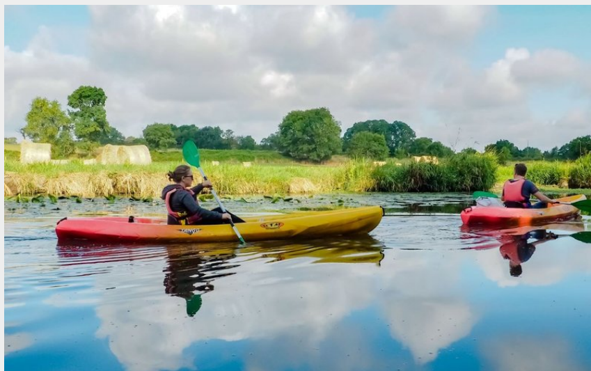
Balade en canoë ou kayak à proximité de Nantes_3