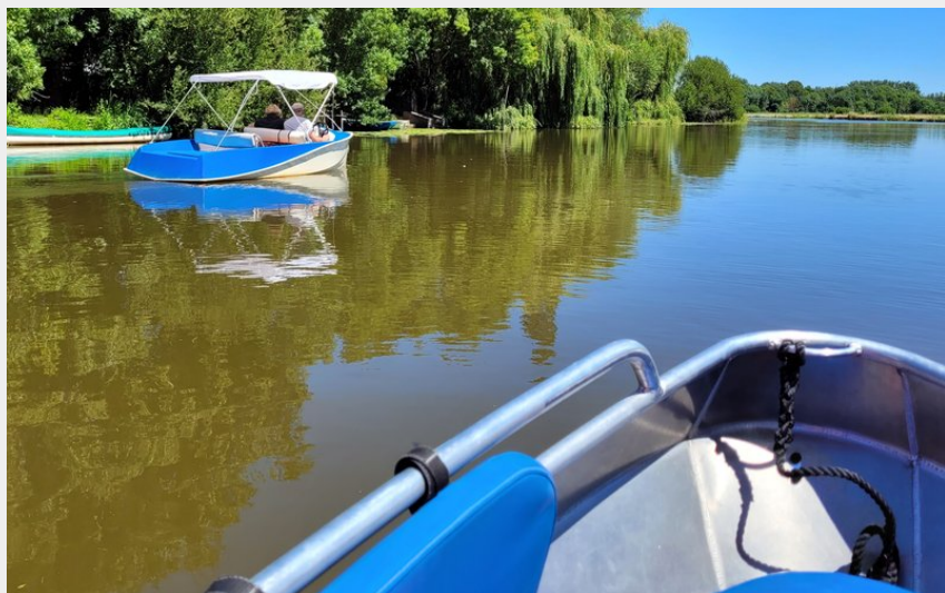
Location de bateaux électriques - Escapade Nature à Port-Saint-Père_1